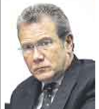
GUTIÉRREZ. Viceministro de Relaciones Exteriores.

El viceministro de Relaciones Exteriores, Gonzalo Gutiérrez, hizo hincapié en las proyecciones que debe tener el Perú para ubicarse como un actor importante de las relaciones internacionales que se vienen dando entre América Latina y la Unión Europea. "El país está en sintonía con la relación birregional que ha surgido a raíz de la cumbre. Se debe buscar que el Perú sea visto como una potencia que genera crecimiento y desarrollo", sostuvo.