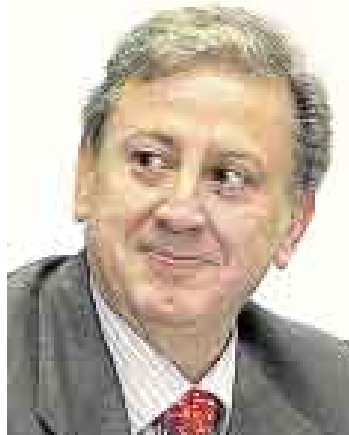
GARRIDO LECCA. Ministro de Salud.

car tecnología e información en los centros de salud del país. "A nuestro sector le cuesta 25 millones de dólares dotar los servicios de Internet a 7.101 puestos de salud del Perú. Es necesario conectar a todos los hospitales bajo esta forma de comunicación, porque esto promueve la formación permanente de los doctores y que más médicos vayan a trabajar a provincias", dijo.