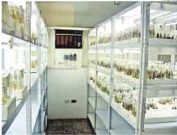
PATRIMONIO GENÉTICO. El Perú debe aprovechar la riqueza de sus productos para combatir problemas alimentarios en otras regiones.

Asimismo, el ministro de Salud mostró la necesidad de apli-