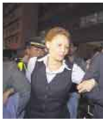
SUDAFRICANA. La madre de la víctima no declaró.