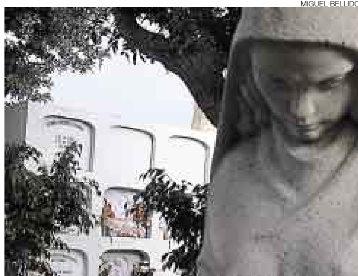
ÚLTIMO ADIÓS. Los restos de la niña de ocho años ultrajada y asesinada en Miraflores descansan desde ayer en el Cementerio Británico del Callao.

La División de Homicidios interrogó a la administradora del edificio en el que vivía la víctima, así como a dos de sus vecinos, en cuyo departamento ella solía jugar con frecuencia.