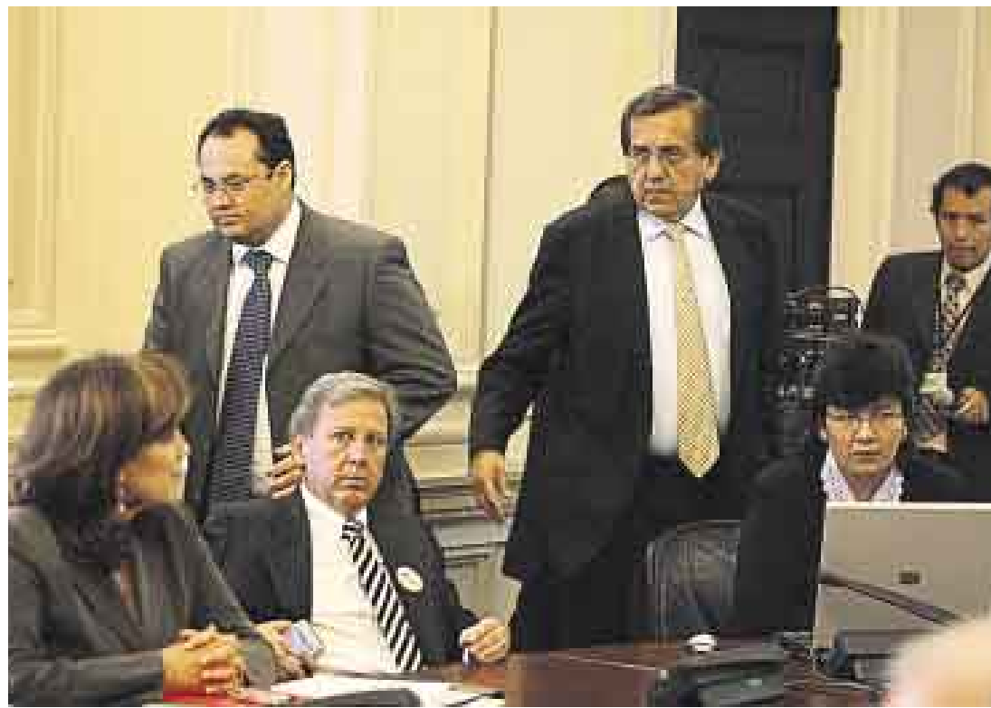
NUEVO ÁNGULO. Algunos ministros destacaron que el debate gire ahora en cuánto más bajará la pobreza.

“Cuando entramos al gobierno había una gran controversia sobre el censo y sobre la encuesta nacional de hogares. Tanto el Banco Mundial como otros centros de investigación habían levantado ciertas dudas sobre si unas encuestas con tasas de ‘no respuestas’ tan altas eran idóneas o no. Optamos por convocar a estos organismos internacionales y se formó un comité auditor. Se corrigieron con parámetros estadísticos las encuestas del 2005 y 2006 que tenían serias deficien-