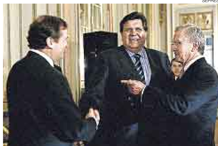
SÍ O SÍ. Alan García insistió en que el Perú no tardará en albergar unos Juegos Olímpicos. Pero primero hay que organizar unos Panamericanos.

El mandatario respondió así a quienes lo criticaron por haber anunciado hace unos días que el Perú postularía para ser sede de los Juegos Olímpicos del 2016, sin tomar en cuenta que el pla-