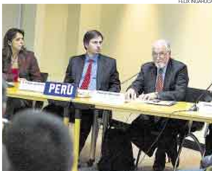
A PREPARARSE. Funcionarios del BM, de la CAN y del Conam anuncian proyectos de adaptación frente al cambio climático.

Este financiamiento, que es apoyado también por el Fondo para el Medio Ambiente Mundial (FMAM), será para el proyecto de adaptación regional frente al impacto del veloz derretimiento de glaciares en los Andes Tropicales (Proyecto Regional Andes) en Bolivia, Ecuador y Perú. Pondrá énfasis en las zonas montañosas y de glaciares.