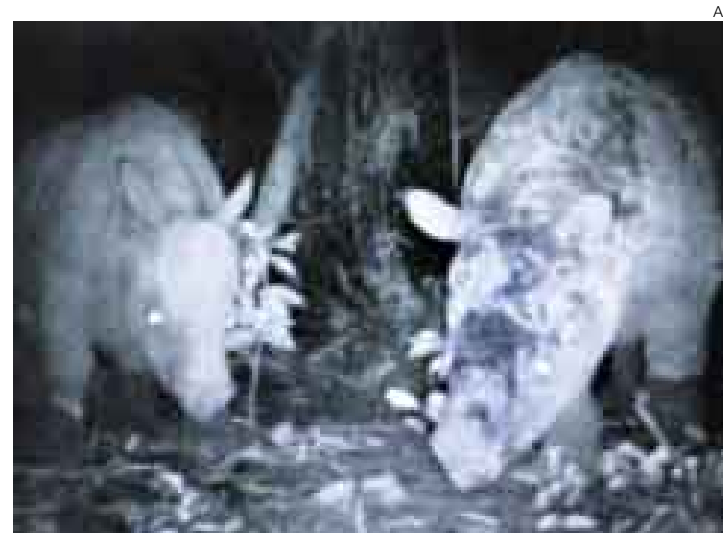
TESTIGO. Vea el video en http://blogs.elcomercio.com.pe/vidayfuturo

YAKARTA [EFE]. Cinco cámaras de video camufladas en un parque natural de Indonesia obtuvieron las primeras imágenes de uso científico del rinoceronte de Java, una especie al borde de la extinción de la que quedan menos de 70 ejemplares en todo el mundo. “Las grabaciones van a ser muy útiles para estudiar a esta especie de rinocerontes”, aseguró Adhi Rachmat Hariyadi, responsable del proyecto en el grupo ecologista Fondo Mundial para la Naturaleza.