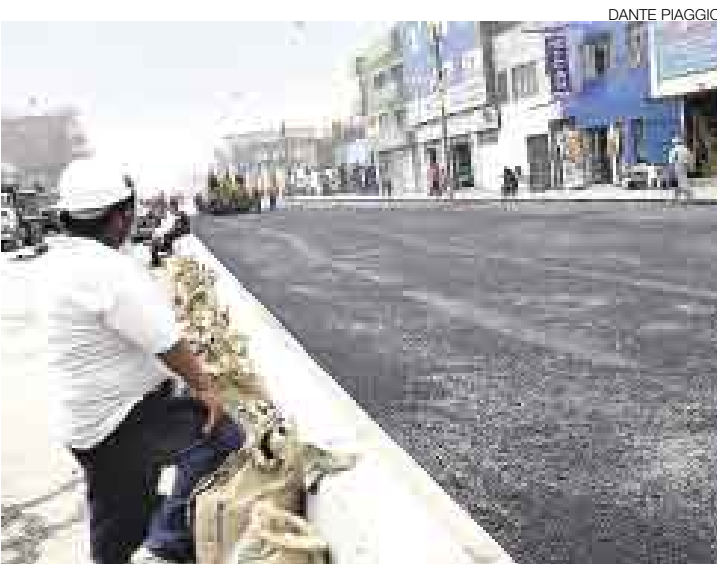
PARINACOCHAS. A fines de junio culminan los trabajos de recuperación de la avenida Parinacochas, en La Victoria. Luego sigue la Av. México.