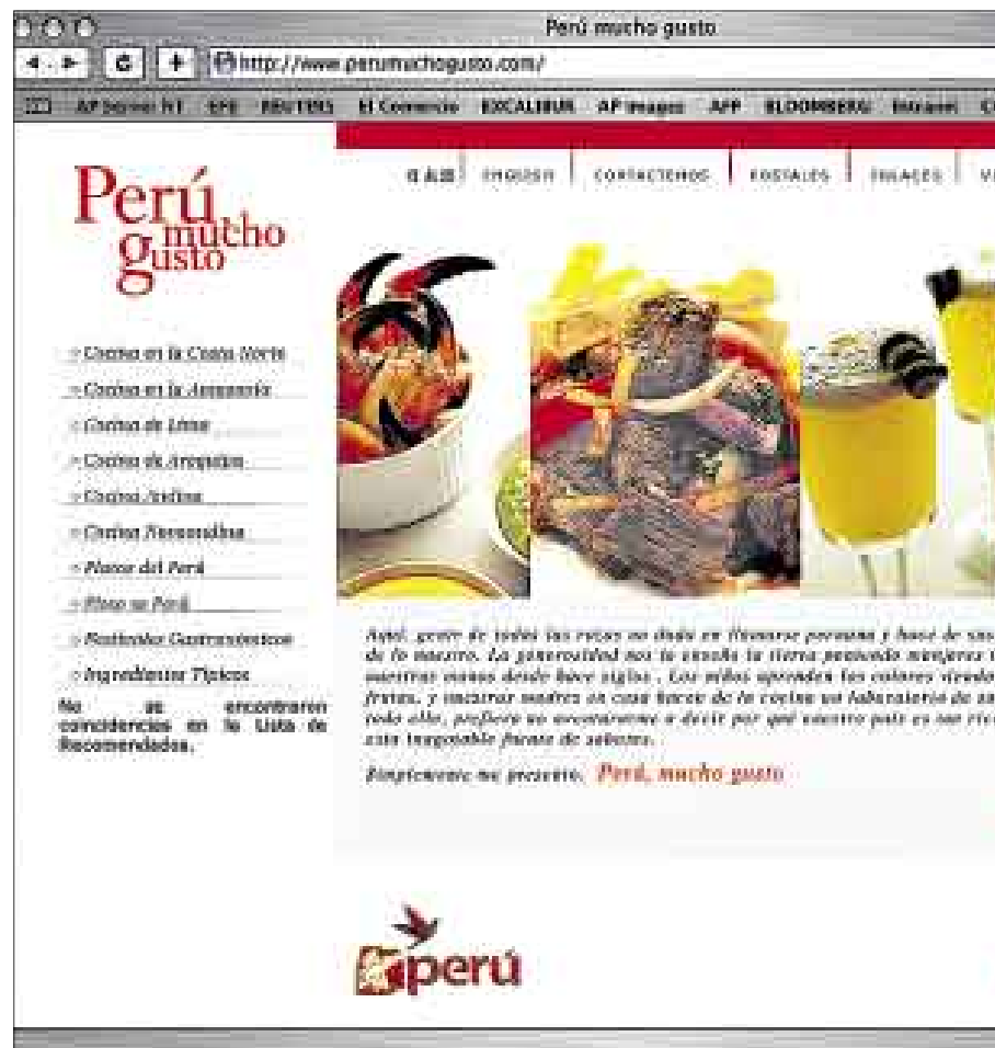
EL PLACER ES NUESTRO. El Ministerio de Agricultura chileno presentó esta semana "Mucho gusto. Chile potencia alimentaria", copia de "Perú, mucho gusto", eslogan que divulgamos hace más de un año. El origen de la papa también entró en la disputa.

rrán ser hijos de la... Mama Oclo? Si ellos hasta cuando bailan lo hacen al ritmo de una danza peruana que fue mutilada en su nombre: la zama-cueca. ¡Qué tal... papa!”