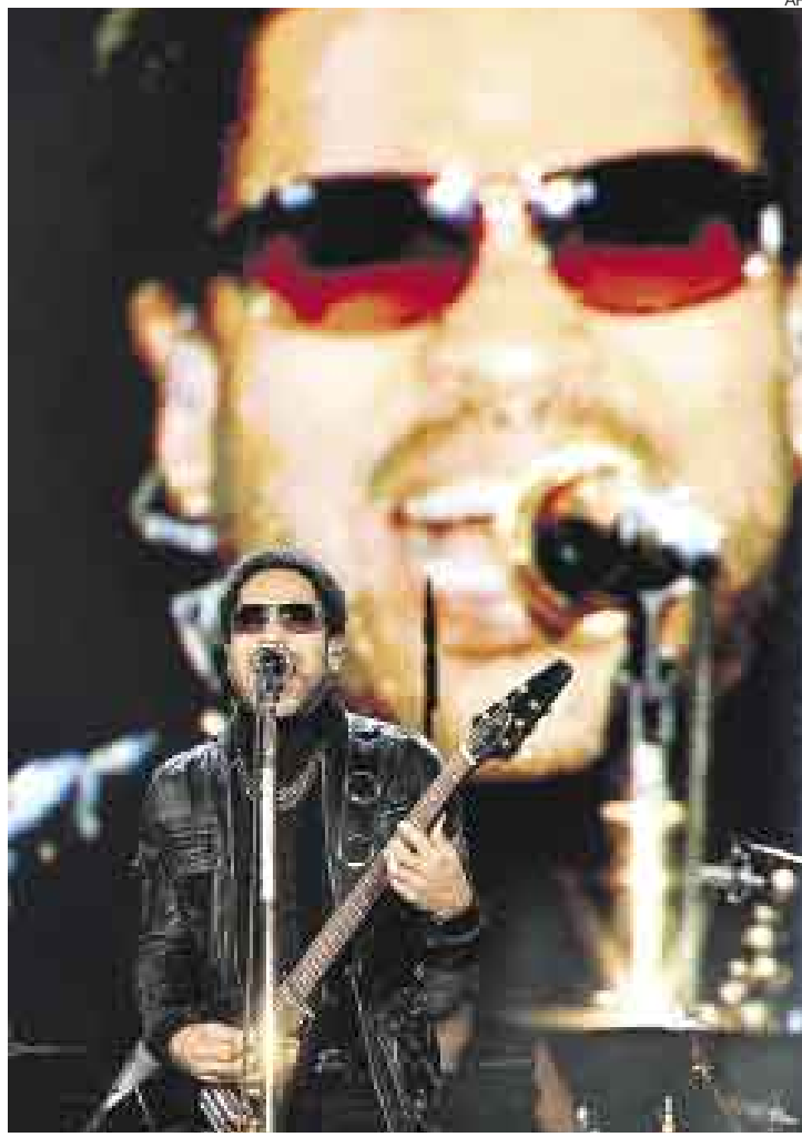
PODER ROCKERO. Kravitz sacudió el parque Bela Vista de Lisboa con su más reciente disco: "It is Time For a Love Revolution".

El encargado de abrir el festival fue el grupo portugués Philharmonic Weed, que actuó en el segundo escenario de la de-