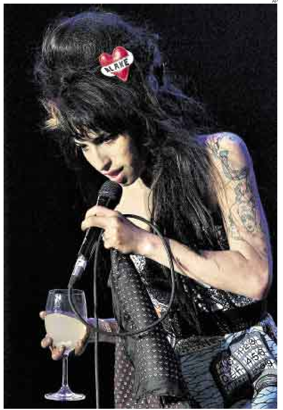
LA DIVA Y SU ELÍXIR. Winehouse no soltó su bebida durante todo su concierto.

nominada 'Ciudad del Rock', situada en el conocido parque de Bela Vista.