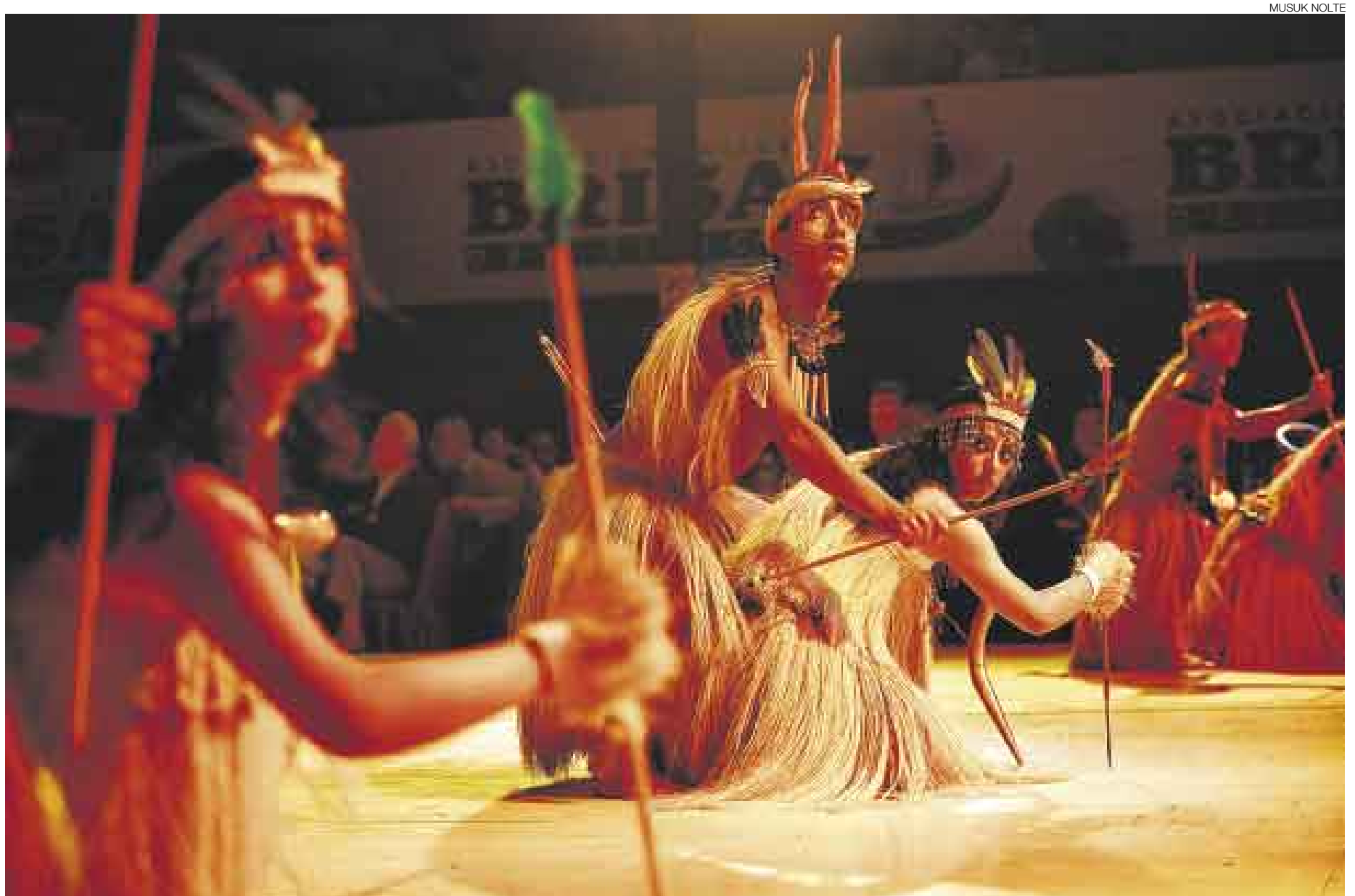
RIGUROSIDAD. La agrupación folclórica es instruida por danzantes locales de la zona originaria del baile. También tienen por asesores a historiadores y antropólogos especializados.

La joven dice que es emocionante cerrar las presentaciones en el extranjero con danzas de la selva y que sueña con llevar a la agrupación a su tierra. Por ahora, sigue desafiando con su mirada al