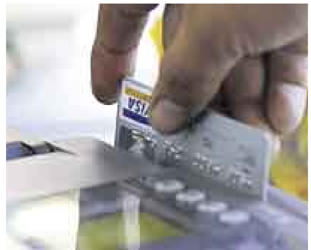
COSTO. ES SIMILAR AL DE UNA TARJETA NORMAL.