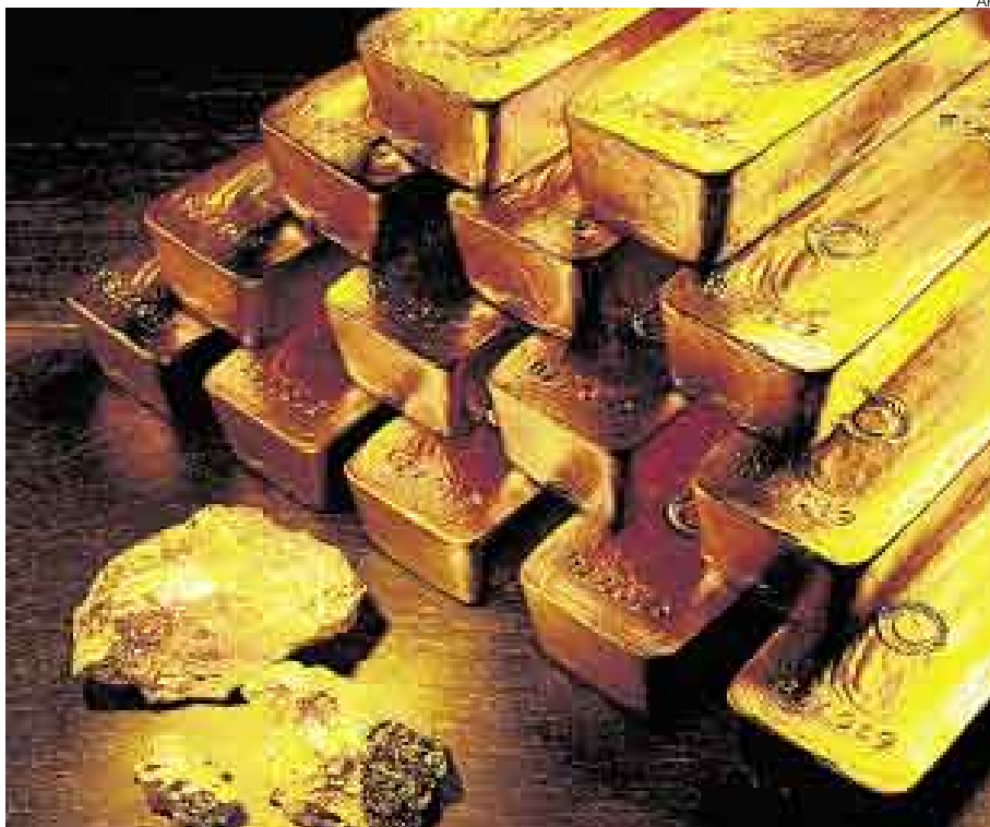
OBJETIVO DORADO. EL ENFOQUE DE IAMGOLD ESTÁ EN PAÍSES EN VÍAS DE DESARROLLO.

Iamgold vendió en mayo el proyecto La Arena, ubicado en La Libertad, a Río Alto por US$48 millones. Como se recuerda, la propiedad la tenía desde el