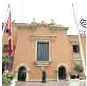
HORA FINAL. LA DECISIÓN ESTÁ EN MANOS DE LA PCM.