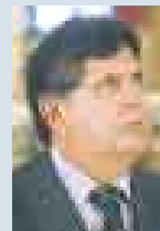
ALAN GARCÍA, PRESIDENTE DE LA REPÚBLICA.

Ahora dice que la reducción de la pobreza es poco creíble y con esta frase incluso niega que su gobierno, como muchos sostienen, haya tenido algo que ver con este logro. Tendrá que afinar su discurso político.