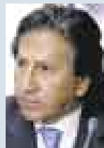
ALEJANDRO TOLEDO, EX PRESIDENTE.

Tuvo una oportunidad de ponerse del lado de los trabajadores, como pregona, en el tema de las utilidades en el Congreso pero prefirió el cálculo político, para no perder posición con sus presidentes regionales.