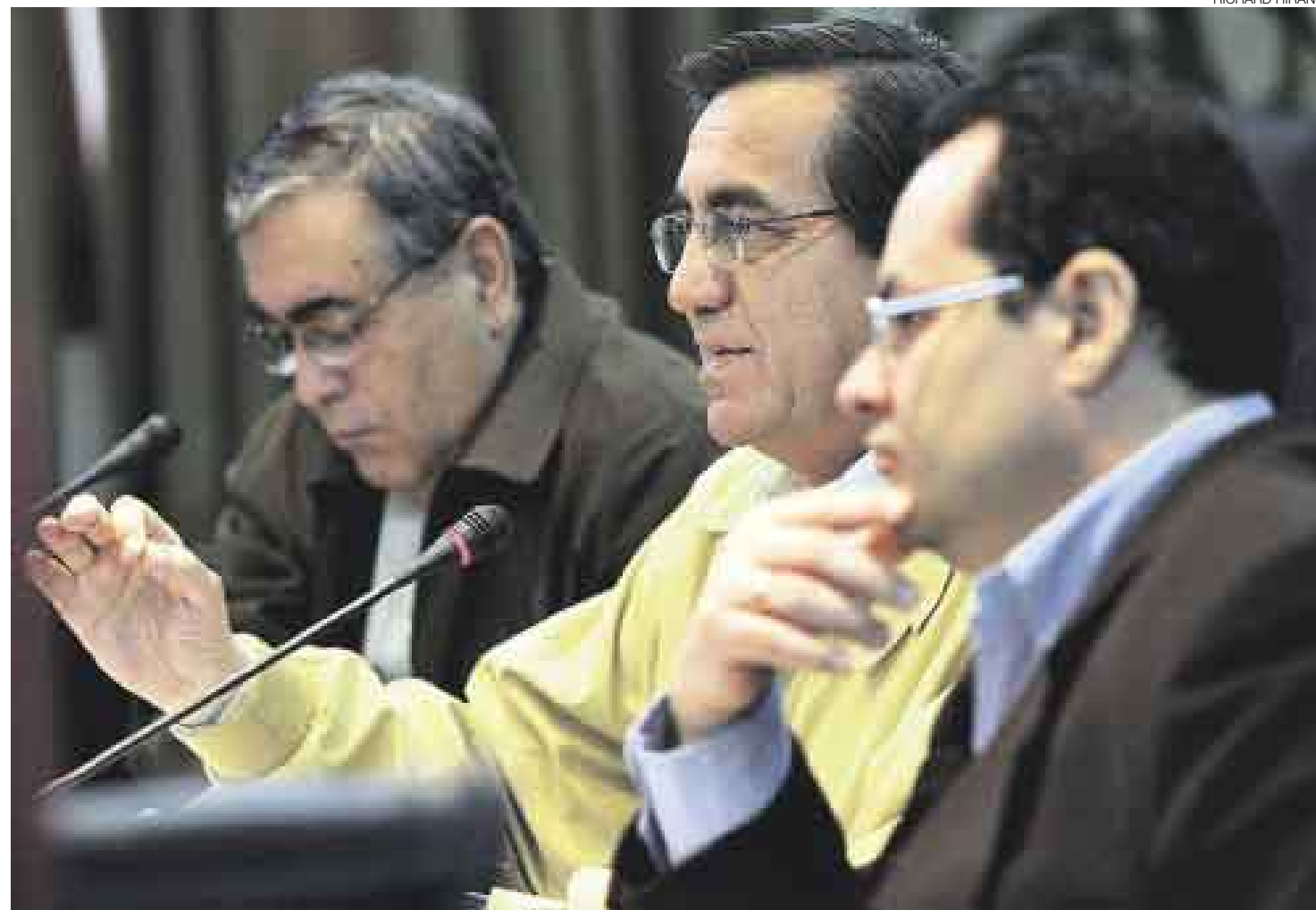
COMPRESIÓN. El presidente del Consejo de Ministros, Jorge del Castillo, al lado de sus colegas de Economía y Finanzas y de Energía y Minas.

vo explicó los nuevos precios de los carburantes y admitió que el Gobierno ha decidido reducir el actual subsidio estatal que está girando al Fondo para la Estabilización de Precios de los Combustibles Derivados del Petróleo. Así, si hasta ayer este subsidio ascendía a 102 millones de soles semanales, ahora se reducirá a 66 millones de soles por semana.