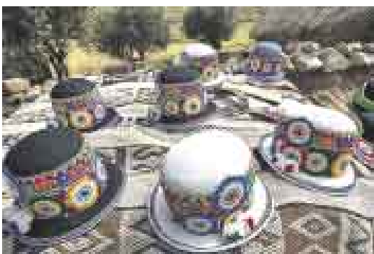
COLORES. Los sombreros cuestan de 50 a 80 soles.

Pascual se desentiende de repente de los extraños y es como si