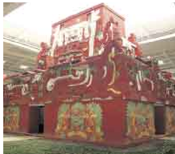
EN EL MUSEO. Réplica del templo de Rosalila hallada debajo de la estructura 16 de la acrópolis central.

El más relevante de los nuevos descubrimientos es la Tumba I. La ubicación, características y ofrendas indican que la tumba era de un importante miembro de la