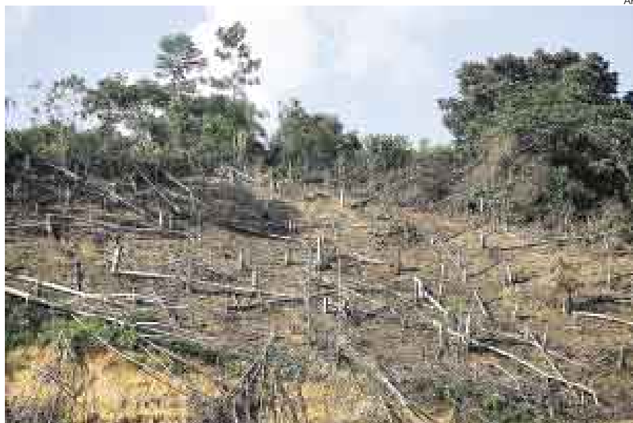
DEFORESTACIÓN. A los cambios que causa el clima se suman los que crea el hombre.

¿Cuál será la repercusión de todo esto sobre el turismo? Ortiz se adelanta a vaticinar: "Los turistas de aventura vienen atraídos por el hielo, pero con el deshielo van a venir menos turistas, y los que vengan van a necesitar acampar para ir a zonas más alejadas, lo cual implica más días de estadía, mayor infraestructura. Además, habrá agua solo unos meses, se perderán bosques,