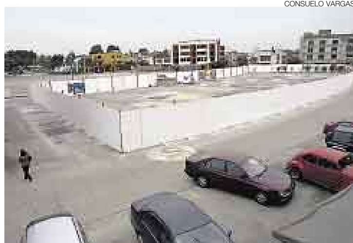
CON CERCO. La Municipalidad de Surco autorizó al propietario del terreno de El Trigal cercarlo, pero no tiene permiso de construcción.

Vecinos de las urbanizaciones La Alborada, Las Gardenias, Vista Alegre y Prolongación Benavides demandaron a la Municipalidad de Surco dejar sin efecto un proyecto inmobiliario que contempla la construcción de un complejo comercial de edificios para oficinas y departamentos de diez y doce pisos de altura, en un terreno ubicado cerca de la intersección de las avenidas Benavides y Velasco Astete.