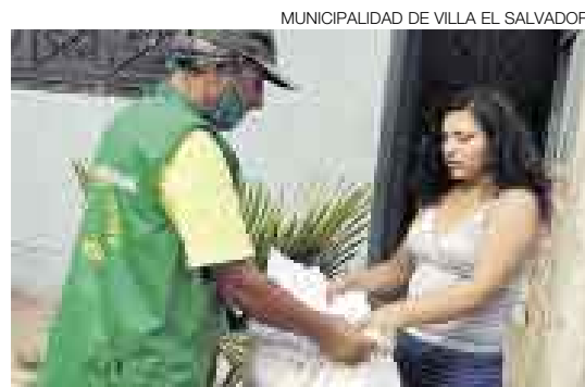
MUNICIPALIDAD DE VILLA EL SALVADOR

■ Asimismo, es importante que las baterías o pilas sean reunidas en una bolsa especial, pues en su mayoría son tóxicas.