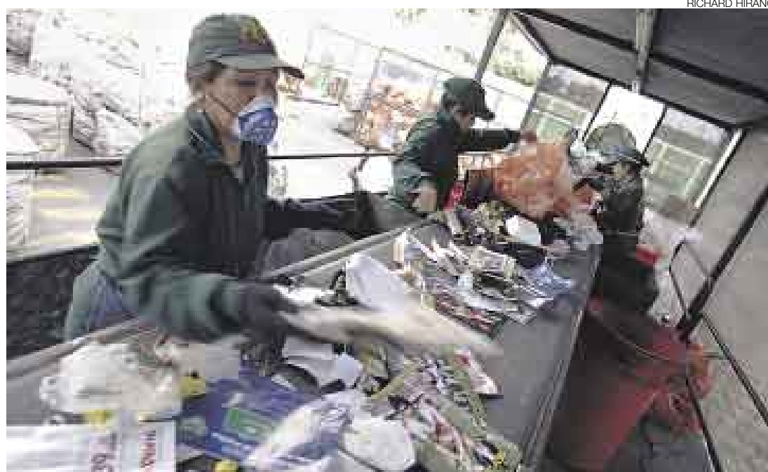
SURCO. El distrito cuenta con una planta que recibe y clasifica 312 toneladas de material reciclable por mes.

Entonces, nos preguntamos cuáles son las comunas que aplican hoy políticas en el tema. El caso emblemático, sin duda, lo tiene la Municipalidad de Surco, que en la actualidad cuenta con una planta de clasificación de residuos inorgánicos que recibe unas 312 toneladas por mes de material se-