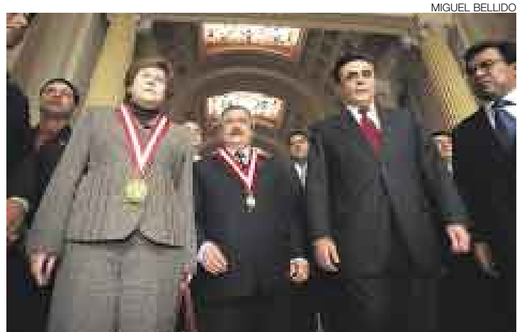
AJUSTES. Gonzales Posada destacó la apertura hacia otras instituciones.

Esta sugerencia fue planteada en la reunión que tuvieron el presidente del Congreso, Luis Gonzales Posada; el titular de la Comisión de Constitución, Javier Ve-