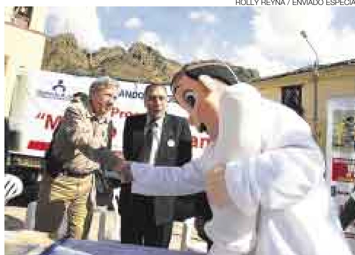
LLEGÓ CON LA INYECCIÓN. El ministro de Salud, Hernán Garrido-Lecca, arribó a Huancavelica para lanzar el programa Médico de la Familia.