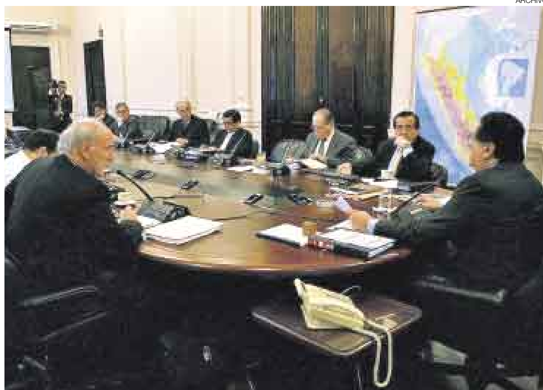
¿SÍ SE PUEDE? Un difícil reto se ha impuesto al Gobierno: hacer variaciones en el sistema interamericano de justicia.

La propuesta del Perú, según el ministro de Defensa, incluye que las denuncias se procesen de