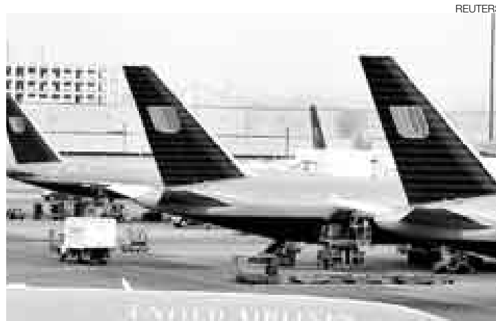
BOEING. United Airlines, una de las líneas más grandes del planeta, se deshará de todos sus aviones Boeing para ahorrar en combustibles.

Los problemas de United Airlines no son los únicos que registra la industria aeronáutica. La Asociación Internacional de Transporte Aéreo (IATA) informó días atrás que sus 230 empresas afiliadas perderían este año unos US$6.000