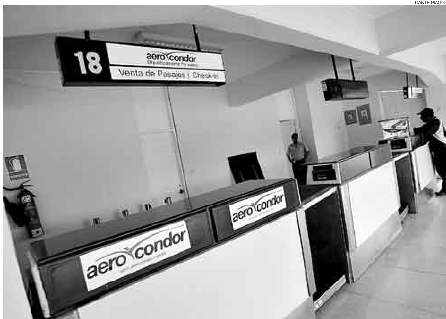
EN GUARDIA. El gremio de empresas aéreas sostiene que el petróleo para aviones debe participar del fondo de compensación para combustibles.

De comprobarse algún perjuicio, el MTC podría pedir al Indecopi una investigación. Independientemente, la Comisión de Protección al Consumidor del Indecopi ya empezó, por su cuenta, un proceso similar para confirmar o descartar daños.