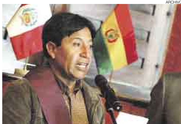
DIPLOMÁTICO. En anteriores alusiones al Perú por parte del presidente Evo Morales, Choquehuanca evitó pronunciarse ante los medios.

zo este comentario luego de recordar que en 1989 asistió en el Perú a una conferencia de prensa de García, momento en el que lo percibió como un “orador de primera, antiimperialista”, y además, “muy flaco”.