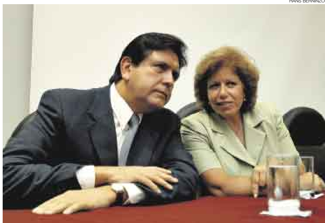
NUNCA DIGAS QUE NUNCA. El presidente Alan García llamó a mantener relación comercial con Chile.

La respuesta de García fue un tanto impersonal: “Se escuchan muchas voces que dicen ‘no le vendan nada a Chile’ y cuidado que Chile si se enoja en cualquier momento puede decir ‘OK, si no me quieren vender, no les compro los US$1.000 millones y les devuelvo los 100.000 peruanos que tengo aquí a los que les he dado residencia’ (...) Hay mucha gente que habla, habla y habla porque patriotas tenemos hasta en la sopa. No sé si van a poner una gota de sangre en algún momento”, dijo como queriendo asustar a los que se oponen a la venta porque tenemos pendiente