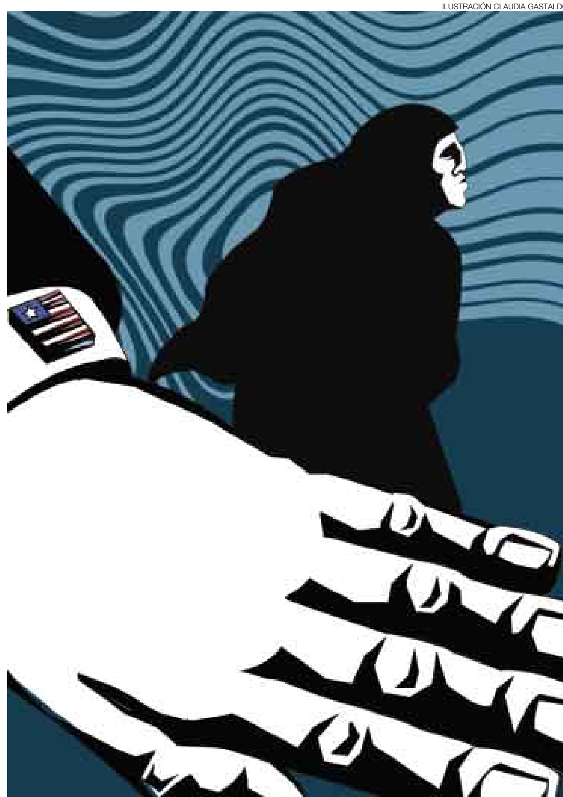
ILUSTRACIÓN CLAUDIA GASTALDO

Y quedó fuera de cuestión que tuviese algún tipo de contacto con dirigentes de Hamas y parlamentarios, escogidos en la única elección libre realizada en el mundo árabe, y muchos de ellos en cárceles israelíes sin pretensión alguna de ser procesados en tribunales. Los pretextos de esta actitud