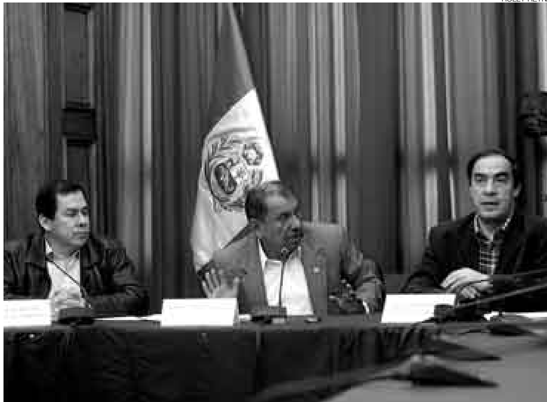
ESCASA ASISTENCIA. La Subcomisión de RR.EE. volverá a invitar al canciller García Belaunde la próxima semana.

“Creo que es un tema anecdótico que no debe alarmarnos. En todas partes hay deseos de figuración, pero siempre hay que tener mucha precaución cuando se habla de temas internacionales (...) este es un caso que para el Perú está en otro nivel, ya no político o de opinión”, explicó el mandatario en alusión a que el diferendo limítrofe se resolverá en la Corte Internacional de Justicia de La Haya, a pedido de nuestro país. Recordó que esa instancia fijará el punto real donde debe situarse el hito de límites. Para García el interés de los parlamentarios chilenos no pasa de un deseo de aparecer en la foto. “Yo no me quejo de que parlamentarios chilenos hagan lo que otros en nuestra patria quisieran hacer”, expresó en alusión a la intención de un grupo de humanistas de llegar hasta dicho punto el año pasado, lo que impidió su gobierno.