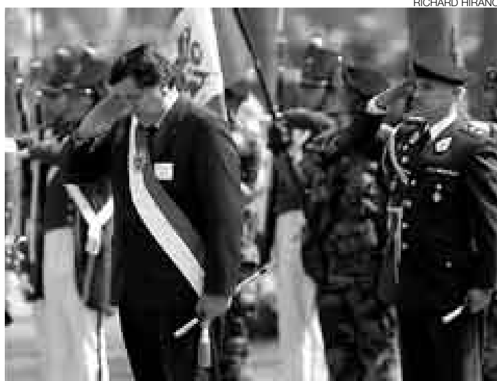
ANIVERSARIO. El presidente Alan García encabezó la ceremonia por el aniversario 128 de la Batalla de Arica en la plaza Bolognesi.

“Primero es el mercado interno, el desarrollo nacional y la construcción de un gasoducto importante que vincule todo el