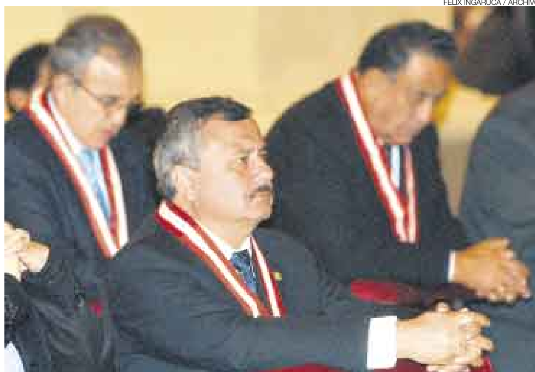
CAMBIOS. La reforma de la Corte Suprema será uno de los temas que el pleno del Congreso debatirá esta semana.

“Una corte de casación es una que no revisa ni evalúa los hechos contenidos en el expediente, no evalúa la prueba, sino la correcta aplicación de la ley y del procedimiento”, explica el constitucionalista Raúl Ferrero. En la propuesta se establece que esta nueva corte podrá escoger discrecionalmente los procesos que decida resolver y establecer precedentes de carácter vinculante.