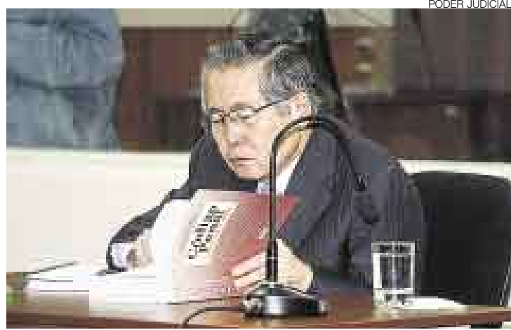
MEJOR. Partidarios reconocen que Fujimori está bien y con buen ánimo.