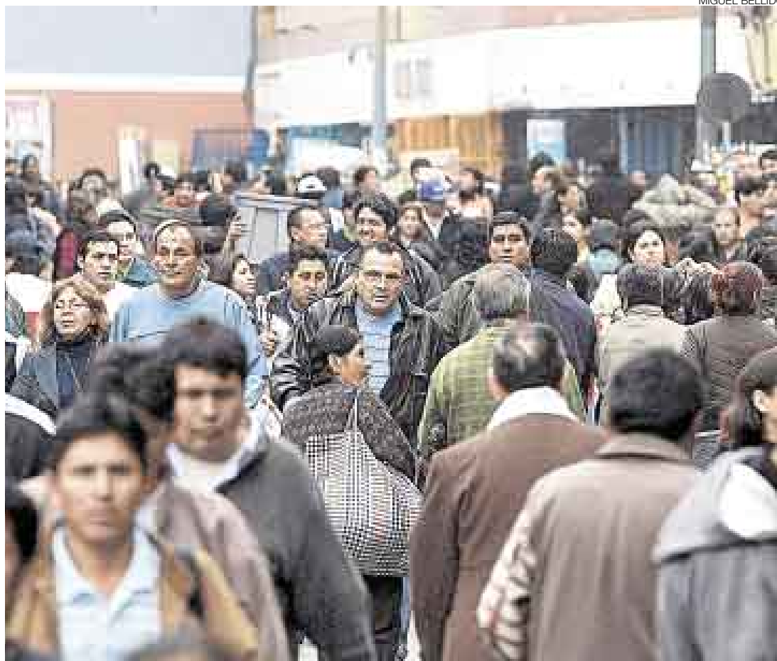
AUMENTO. Cada año nuestra población ha crecido en aproximadamente 400 mil habitantes, según el último censo.

Si se comparan los resultados preliminares del 2007 con los correspondientes al censo de 1993, en los últimos 14 años la población peruana se incrementó en 1,6% anual, es decir, en 398.666 habitantes por año, lo que confirma la tendencia demográfica decreciente del país