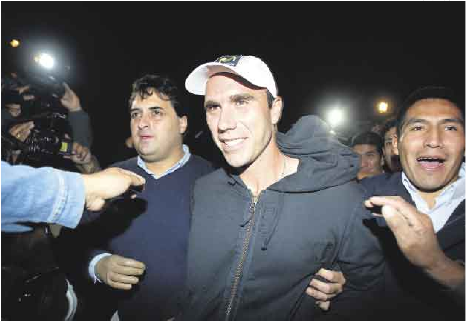
DE REGRESO A LIMA. Apenas se percataron de la llegada de Luis Horna al aeropuerto Jorge Chávez, decenas de aficionados aplaudieron y felicitaron al flamante campeón del Roland Garros.

Roland Garros: Este título ha sido algo sumamente importante. El más valioso de mi carrera, sin duda. Lotengo que disfrutar. Cada partido tuvo su cuota de complica-