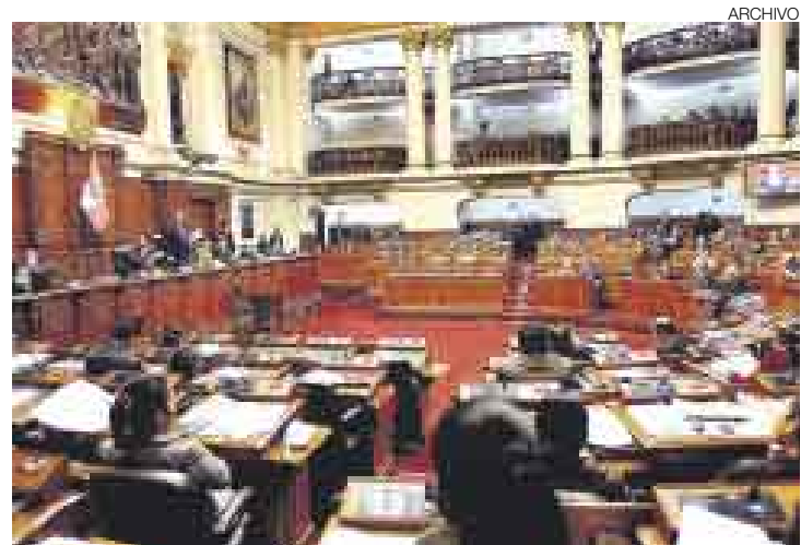
EL ACABÓSE. Se planificaron tres días enteros de pleno, para debatir y aprobar reformas constitucionales, pero finalmente no se vio nada.

Desde el Ejecutivo, el primer ministro, Jorge del Castillo, recalzó que el actual Poder Legislativo resulta inviable para aprobar reformas constitucionales. “Con gente bullanguera que solo hace tumulto ello es imposible, no me