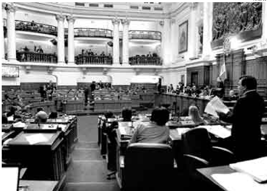
SE BUSCA REEMPLAZO. El próximo 26 de julio se elegirá por voto secreto a la nueva Mesa Directiva del Congreso.

Sin embargo, Mekler se reservó el nombre de su candidato para fines de mes. También aprovechó para aclarar que este interés de su partido no debe