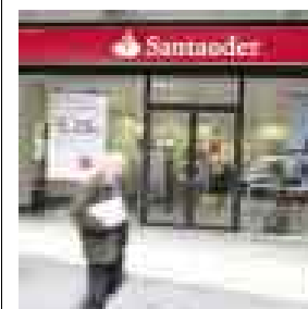
MÁS CERCA. PODRÍA ABRIR ALGUNAS OFICINAS.

Pese a que el Santander en Lima lo negó, el rumor desde Chile viene muy fuerte como para que en En Off lo ignoremos. Un gerente de alto rango que tiene que ver con el negocio del mercado de capitales de Santander Chile está en Lima. Si hay un buen momento para potenciar este negocio es ahora, que nuestra economía crece y las necesidades de financiar el crecimiento se hacen mayores y más sofisticadas. Del total de empresas, las pequeñas y medianas son el 85%. Como para poner una SAB, ¿no?