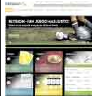
MERCADO. LOS PERUANOS GUSTAN DE LAS APUESTAS.

Uno de los portales más grandes del mundo de apuestas en línea, Betsson, decidió ingresar a América Latina a través de la puerta del Perú. El motivo para establecer su presencia en nuestro país fue el crecimiento del acceso de la población a Internet.