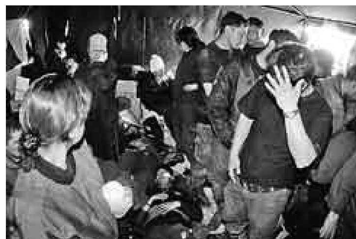
INCERTIDUMBRE. Por la noche, los policías cautivos recibieron comida y agua. La Defensoría del Pueblo envió a personal para interceder por ellos.

mó una cadena humana para impedir que fueran agredidos, aunque no pudieron evitar que la turba les lanzara piedras y agua.