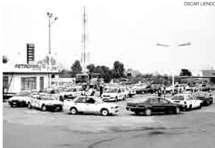
LARGAS COLAS. Los tacneños han recibido combustible, pero ahora les falta gas para poder atender muchos negocios.

En total fueron cinco los camioneros que lograron pasar el puente Montalvo, aunque ello les significara entregar bolsas o cupos a algunos cabecillas que no pudieron identificar. Tras hacer la entrega del dinero, los pesados vehículos cargados con