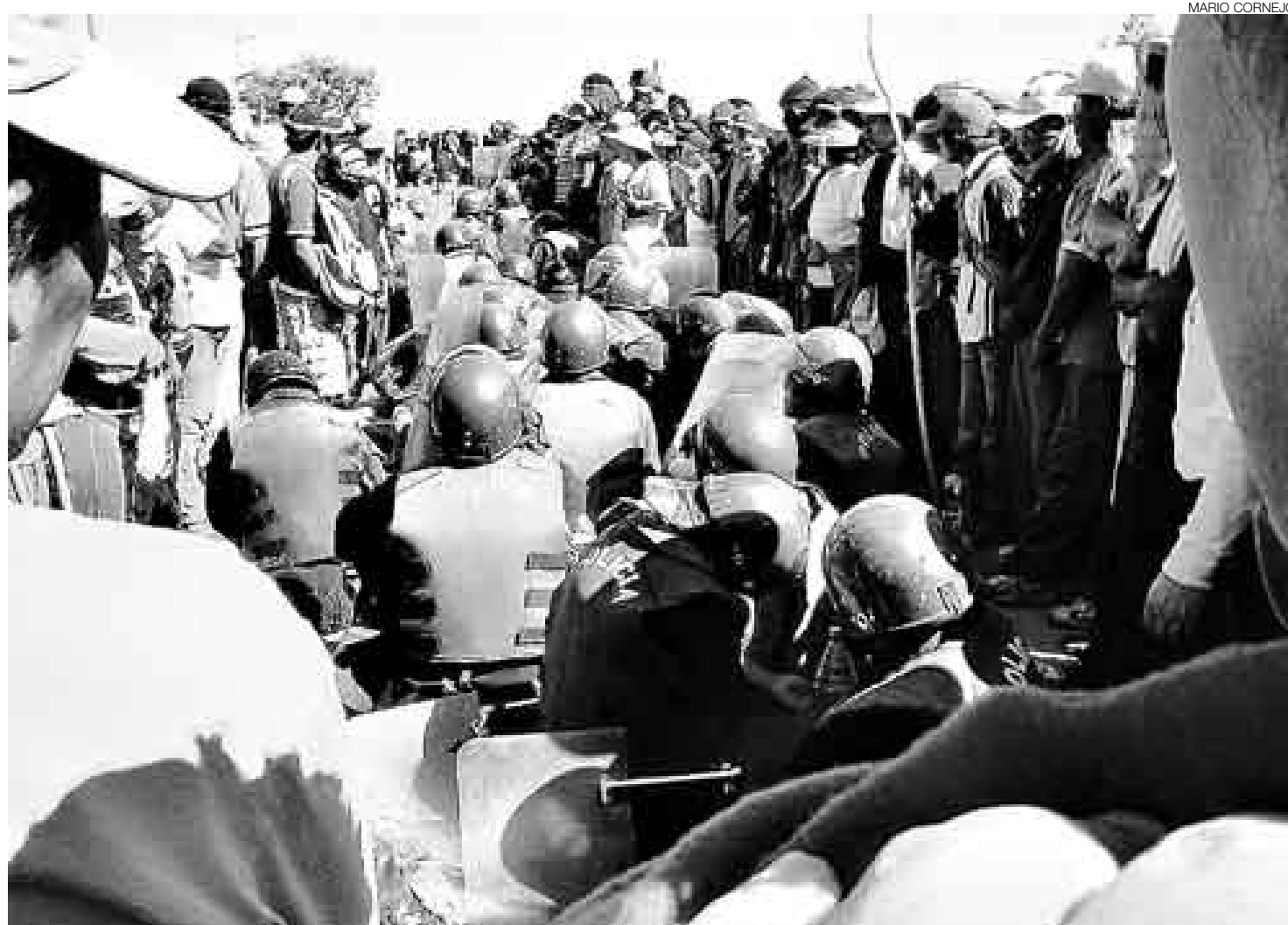
IMAGEN ELOCUENTE. La fotografía lo dice todo: los policías fueron dominados por los manifestantes. La operación de seguridad falló.

Una vez retenidos, los agentes fueron recluidos en una carpa del Ministerio de Salud, instalada en la zona; ahí un grupo de mujeres for-