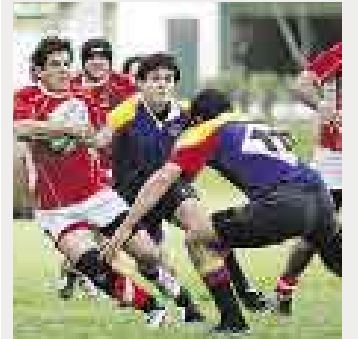
FEDERACIÓN DE RUGBY

CON FUERZA. La selección apunta al título continental.