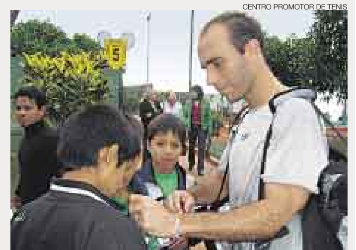
CENTRO PROMOTOR DE TENIS