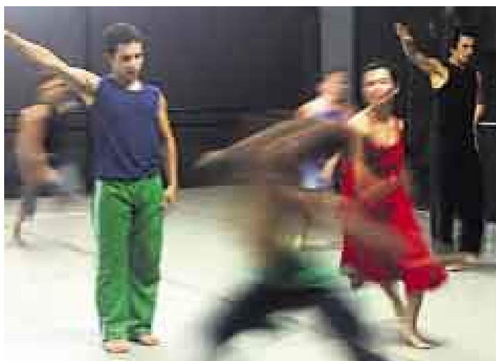
ESTILO. La compañía presenta coreografías con fuerte contenido expresivo.

larines salen preparados para crear obras y si bien está especializada en danza contemporánea, emplea la danza clásica para la formación técnica de sus estudiantes. Un maestro determinante para desarrollar el carácter de la escuela fue Hans Züllie, bailarín del primer movimiento de danza moderna expresionista de Alemania de los años 20 y 30 que llegó a Costa Rica en el 79 y que marcó la compañía con su estilo técnico de limpieza y rigor.