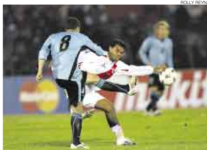
POBRES. El drama del fútbol peruano pasa por un tema de formación.

Muchas veces he escrito que los problemas de nuestro fútbol no se solucionarán cambiando los entrenadores, jugadores o sistemas tácticos. El problema es mucho más profundo, se tra-