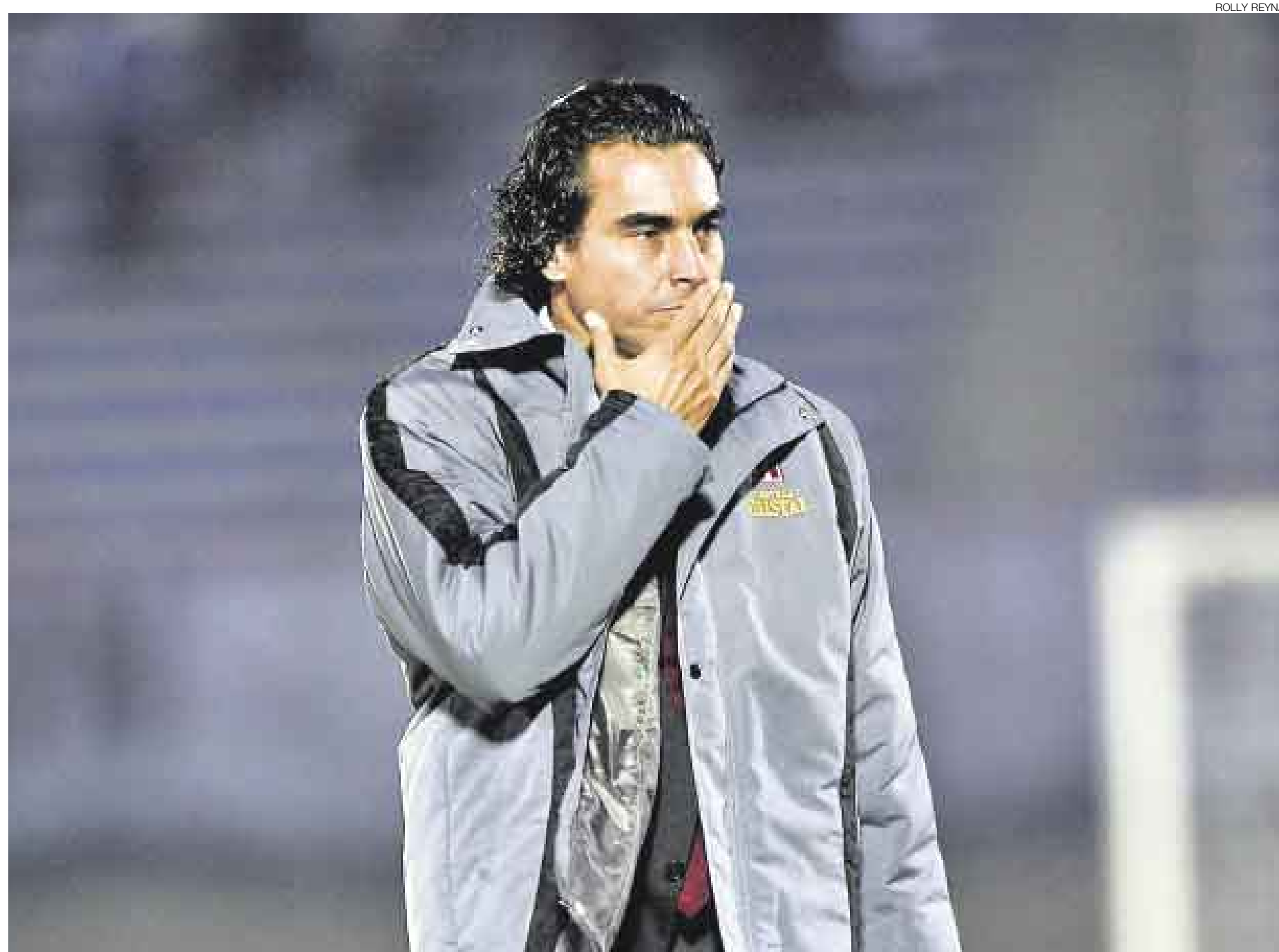
¿POR QUÉ NO TE CALLAS? Del Solar agravó mucho más su situación como técnico de la selección después de que se descifrarán las frases procaces que pronunció en Montevideo.

UNIDOS: AGREMIACIÓN Y ADFP ALISTAN MEDIDAS PARA PROPONER SALIDA DE BURGA