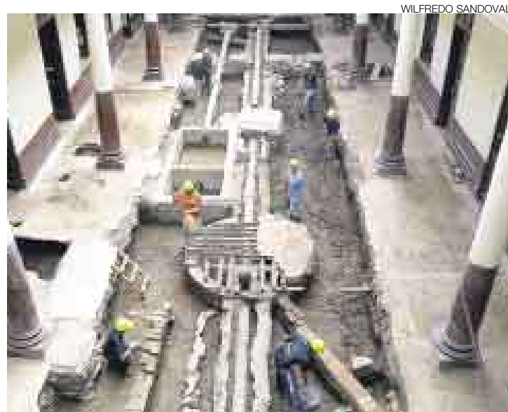
EL PASADO IMPORTA. Palacio Municipal de Chiclayo data de 1919 y se estima que la construcción costó algo más de 30 mil libras de oro.