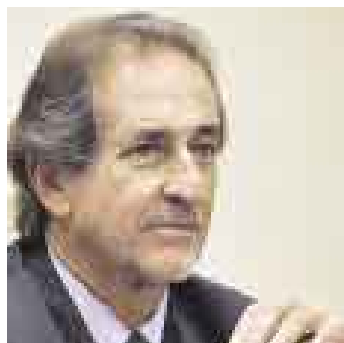
CÁCERES. Se muestra optimista.

El presidente de la República, Alan García Pérez, sostuvo que los cambios que se fomentan nunca se habían establecido en la historia del país, ya que por primera vez los empleados estatales serán evaluados