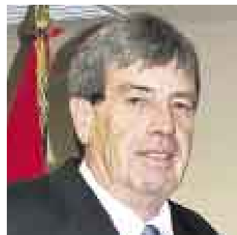
ANDERS. Seguro de una mejora.

Según algunos representantes de gremios empresariales, esta ley hará más eficiente la ges-