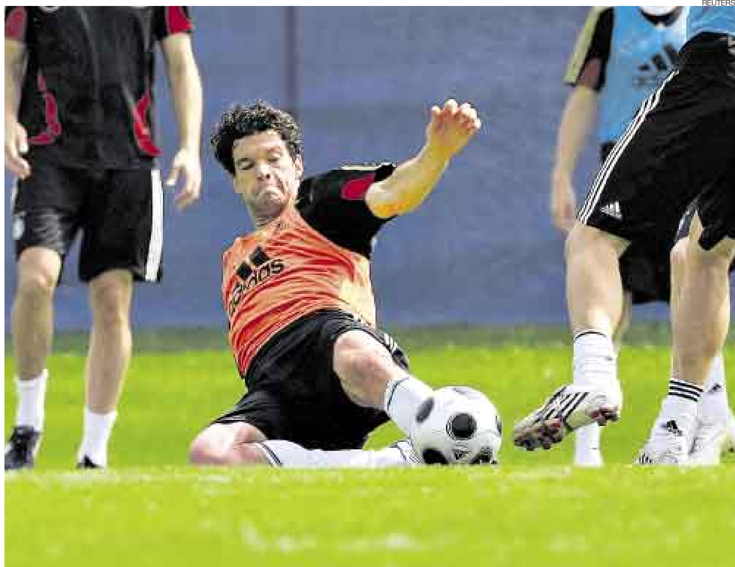
CAPITÁN Y CONDUCTOR. La estrella de Alemania se llama Michael Ballack, quien a los 31 años espera ganar algo importante con su selección.

Ni los reveses recientes de perder la Champions y el título de la Liga Premier a manos del Manchester United lograron minar su confianza desde que está en Suiza.