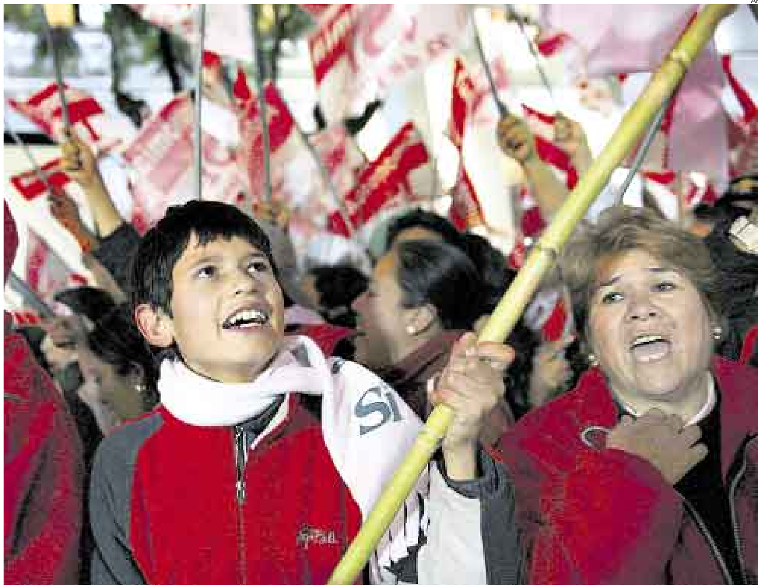
ALZAN LA VOZ. Los prefectos de los departamentos opositores han puesto en jaque al Gobierno al no querer someterse al referéndum revocatorio.

El gobierno de Morales descartó ayer el diálogo con los prefectos rebeldes. El Ejecutivo amenazó con llevarlos a juicio