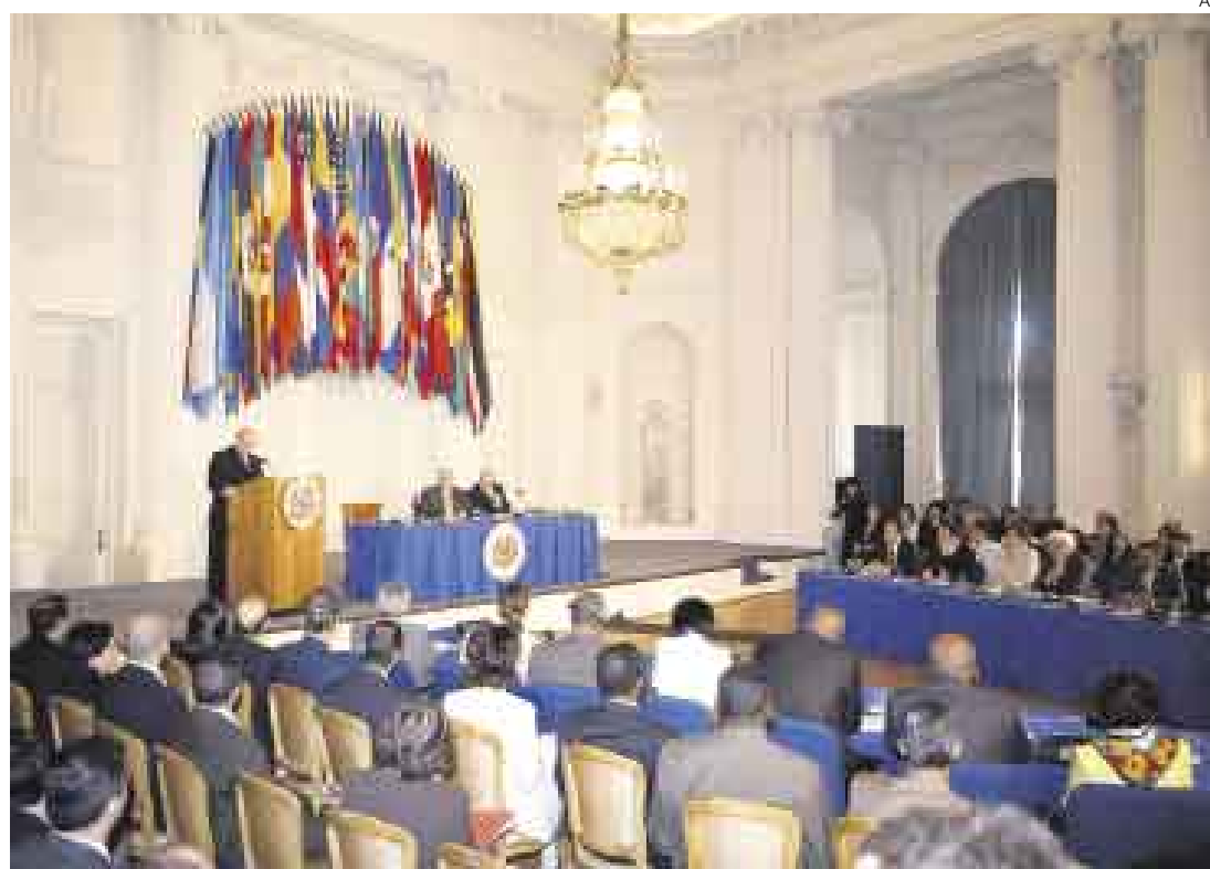
DEBATE. El secretario general de la OEA no creía posible una reunión inmediata del consejo, pero sí será posible.

También adelantó que la OEA emitirá un pronunciamiento—cuyo documento prepara la misión peruana— con sus inquietudes acerca de la polémica ley, que será