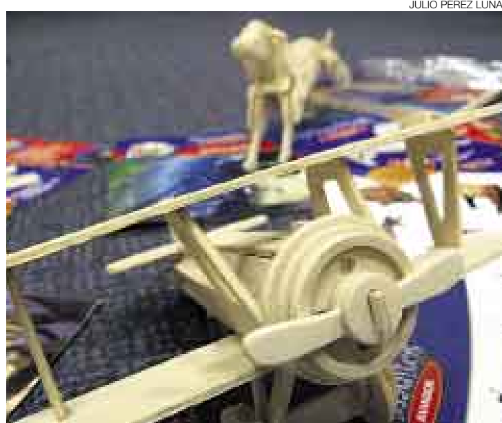
JULIO PÉREZ LUNA

La primera entrega costará S/.8 más el cupón de descuento. Luego, cada fascículo valdrá S/.18 más el cupón y S/.30 sin el vale. ●