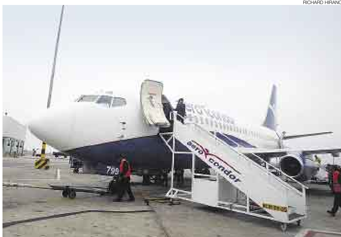
POR FIN. El 2005, Sky Airline anunció el inminente inicio de sus operaciones de manera regular (no chárter) en el Perú. Este año podría estar más cerca que nunca de empezar de la mano de Aerocóndor.