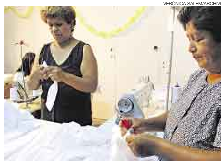
ALIVIO. Las mypes ya no serán obligadas a contar con más de un cliente y en ciertos casos tendrán un año de plazo para cumplir esta obligación.