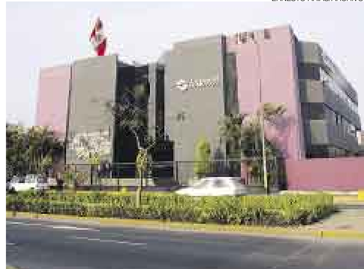
EN CAMINO. La nueva estructura y organización del Indecopi entrará en vigencia en 60 días. El reglamento de la ley se expedirá en 90 días.

■ Ejecutivo también aprobó norma para reprimir conductas anticompetitivas