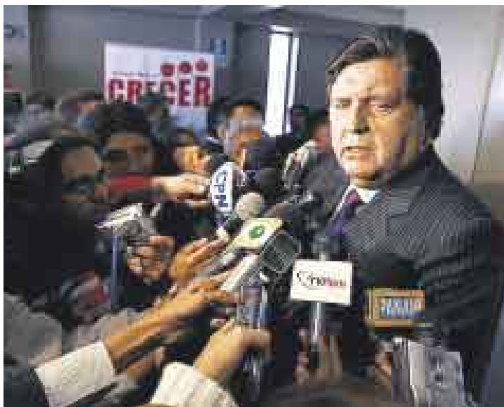
ADVERTENCIA. El jefe del Estado alertó acerca de intenciones desestabilizadoras de algunos movimientos.

“Hay personas que políticamente quieren aprovechar esto para organizar paros, revueltas, revoluciones, tomas de carreteras y de caminos. Todo eso tiene una motivación política”, explicó.