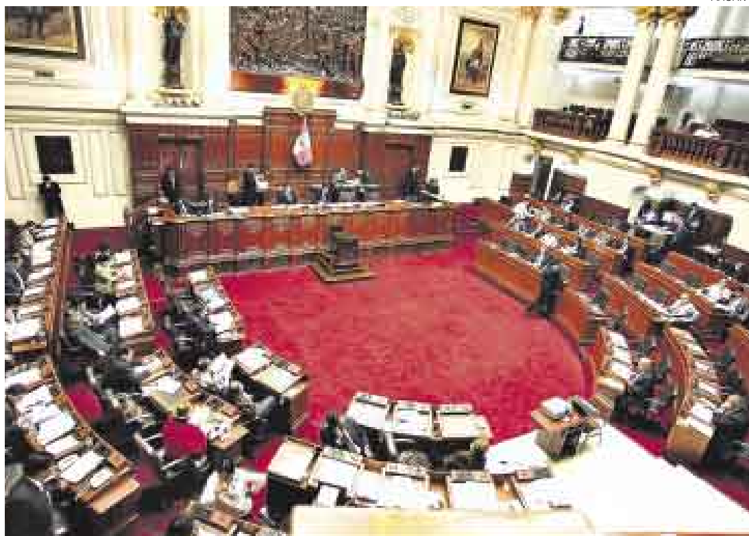
INCERTIDUMBRE. La oposición sigue dividida respecto de si respalda o no al aprismo en la Mesa Directiva