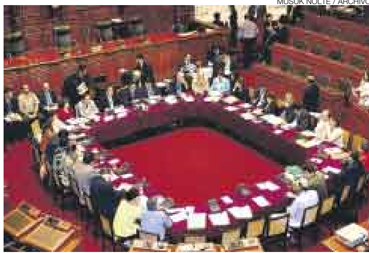
ARDUO TRABAJO. La Comisión Permanente volverá a asumir sus funciones legislativas este 2 de julio. En su agenda hay 107 proyectos de ley.

El segundo punto es un dictamen que propone agilizar el procedimiento para la entrega de licencias de funcionamiento.