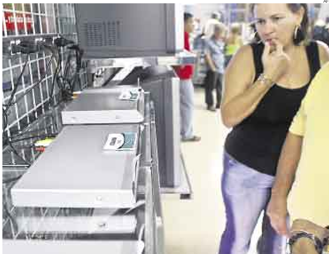
MÁS TRANSPARENTE. Las ofertas de las casas comerciales deberán traer ahora información más completa.

"La misión de la ley (complementaria de protección al consumidor) es mejorar el sistema ac-