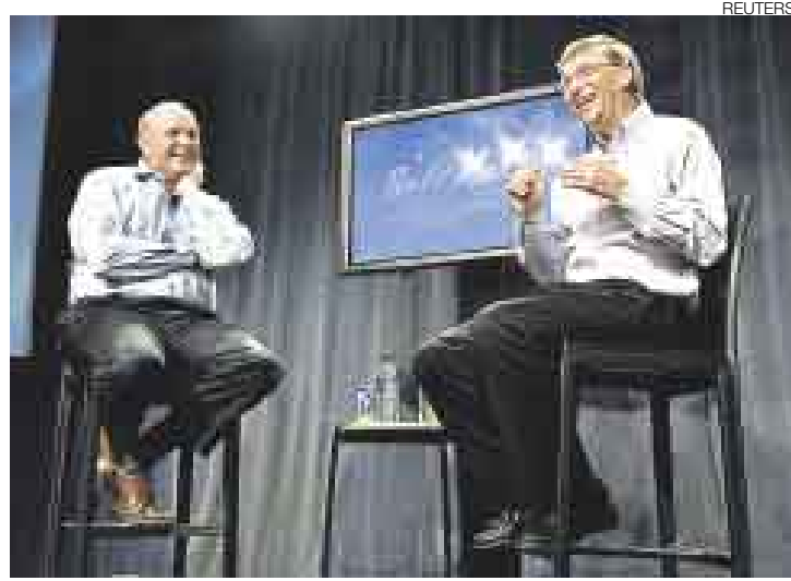
CAMBIOS. Bill Gates se despidió de los empleados de Microsoft la tarde de ayer. Steve Ballmer (izquierda) tomará el timón de la empresa.

Según se supo, Gates seguirá siendo presidente del Con-