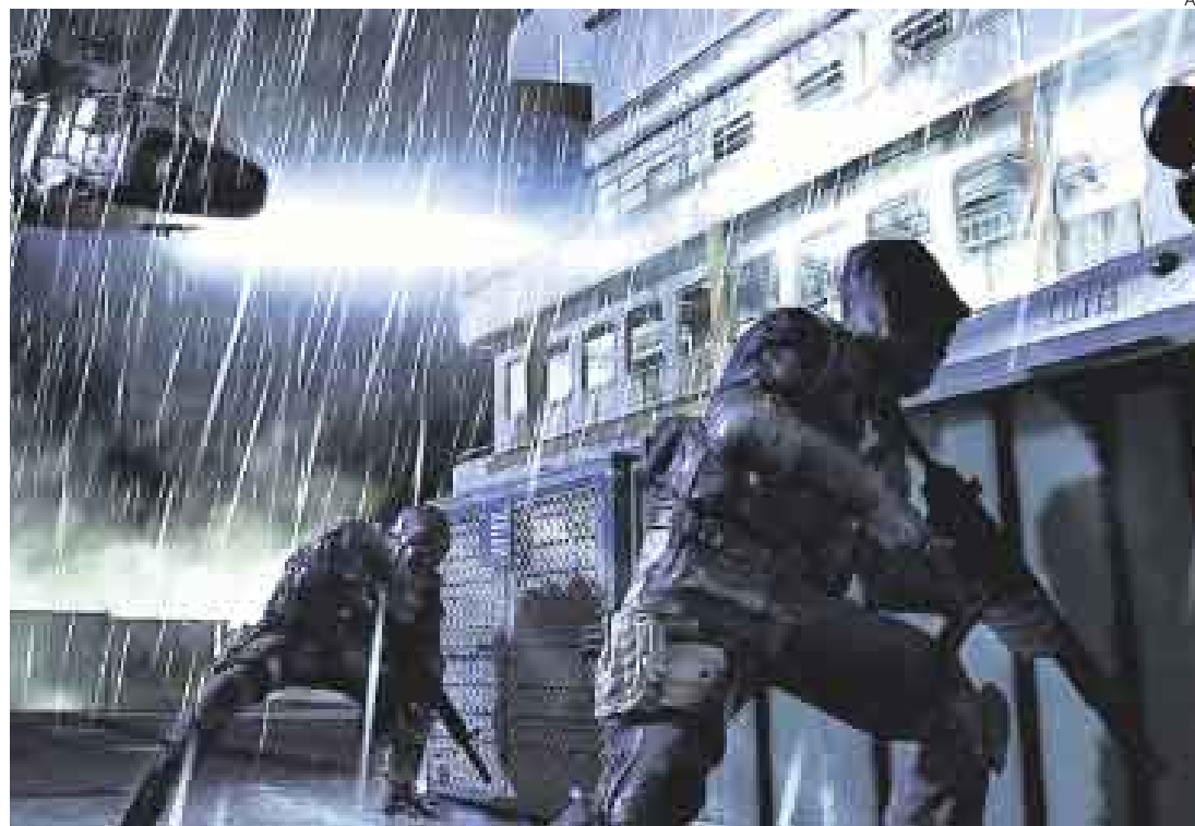
POPULAR. Sus características técnicas hicieron que Call of Duty 4 se convirtiera en uno de los preferidos.

No se trata del clásico juego que sitúa la historia en la Segunda Guerra Mundial para luchar contra los nazis. La propuesta enfrenta al jugador con terroristas