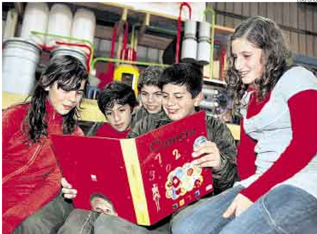
DIVERTIDAS LECCIONES. Sus hijos podrán entretenerse con conocimientos sobre matemáticas, física y química.

La responsabilidad del aprendizaje de los más pequeños no solo recae en los profesores, en el sistema o en ellos mismos. ¿Cuántas veces nos hemos acercado a nuestros padres o recibimos la consulta de nuestros hijos sobre problemas aritméticos sin tener respuestas? Es por eso que el rol de los encargados del hogar es importante en esta meta educativa. Esa es una de las principales funciones de esta serie de fascículos científicos: brindar una