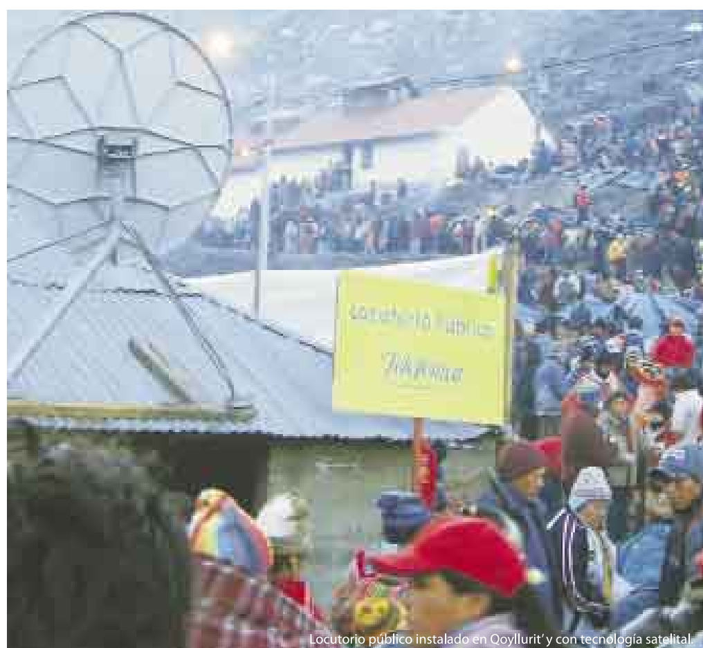
Locutorio público instalado en Qoyllurrit'y con tecnología satelital.

La presencia de Telefónica en Qoyllurrit'y forma parte del compromiso de la empresa para facilitar el acceso a las comunicaciones de las zonas más alejadas del país y reforzar el mensaje del cuidado del santuario.