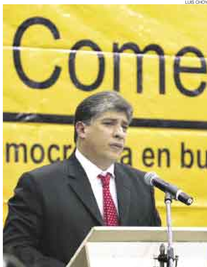
DISCURSO Y SILENCIO. El alcalde habló de su gestión, pero no ofreció disculpas por la detención de cuatro deportistas liberados después por la fiscalía.

“No va a haber edificios de 33 pisos en el distrito. No se aprobará nada que no se ajuste a la zonificación”, señaló enfático el burgomaestre distrital, quien no dijo si llevará al alcalde de Lima, Luis Castañeda Lossio, la voluntad de los vecinos de no aceptar construcciones altas, expresada en una