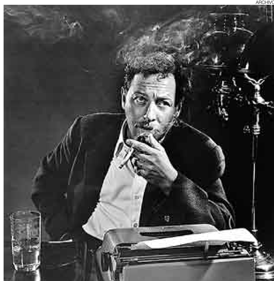
ARCHIVO TENNESSEE WILLIAMS. Periodista y escritor norteamericano cuenta en sus "Memorias" su vida con gran soltura y pormenores.

Y con mucho detalle, además. Escribe: "¿Es posible ser un viejo verde a mitad de la treintena? Porque quizá sea esta la impresión que estoy causando. Este libro es una especie de catarsis de puritanos sentimientos de culpabilidad,