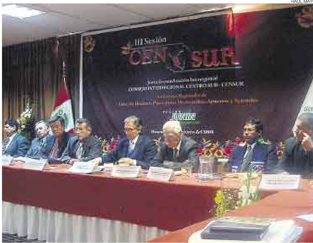
UNIDOS. Los miembros del Censur se reunieron para definir mecanismos que faciliten la inversión en sus regiones.

En ese sentido, el Censur acordó concertar estrategias para desarrollar la infraestructura productiva de sus regiones e impulsar la construcción del ferro-