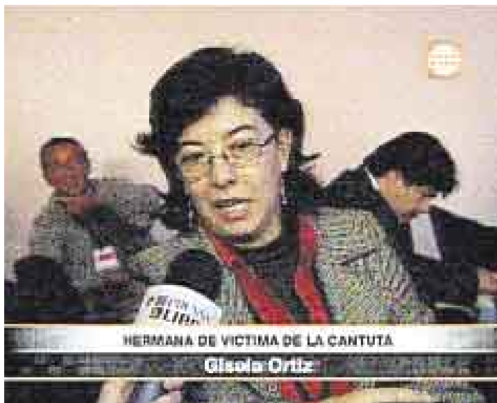
EXPECTATIVA. En la sala de visitantes había deudos de La Cantuta, Barrios Altos e incluso de otros casos de violaciones de los DD.HH.

La mañana ha sido pródiga en señales hirientes. La entrada de Montesinos a la sala, con sus venias al acusado y al tribunal, en ese orden, dejó muda a la audiencia de agraviados. Las palabras del ex asesor y su actitud desafiante para las respuestas despertaron leves murmullos de fastidio. Pero es su negativa final a seguir respondiendo lo que inflama temperamentos serenos. "Ha apelado a la utilización vergonzosa de un espacio público", critica Ortiz poco después.